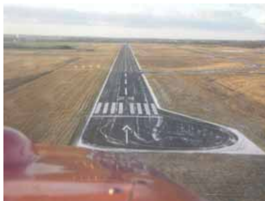
Billede fra anflyvning til bane 29 i Roskilde.

Året har været meget hektisk - med aktiviteter omkring Allerød flyveplads, som nu er solgt til Lind & Risør (og måske har talte dage som flyveplads). Dette påvirker muligheder for at dyrke faldskærmsaktiviteter fra pladsen samt motorflyvning.