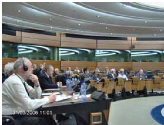
Billede fra møde i Eurocontrol i Bruxelles.

mod reglerne, at man fra EASA's side åbent erkendte, at man var nødt til at revurdere hele sagen, hvorfor man sammen med EAS nu har nedsat en fælles arbejdsgruppe, der skal definere et sæt tilfredsstillende regler og vi har stor tiltro til, at dette arbejde kan afsluttes med succes. Som reglerne antageligt udformes, åbner de store muligheder for ejerpiloter af alle lette fly for egen vedligeholdelse. EASA har på møder i efteråret oplyst, at man nu har erkendt, at de regler, som hindrede os i at montere ikke godkendt luftfartsmateriel i vore fly – f.eks. el-variometre, loggere og Ipaq's – skal skrives om, og at arbejdet hermed er i gang. Også her forventer vi således en tilfredsstillende løsning.