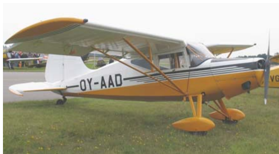
Forhandlingerne med KZ & Veteranfly Klubben fortsatte ind i 2008.

Veteranflyveklubben besluttede på deres generalforsamling i efteråret, at der skal ske tilslutning til KDA. Efterfølgende har der været kontakter til klubben, der dog endnu ikke har resulteret i en overenskomst.